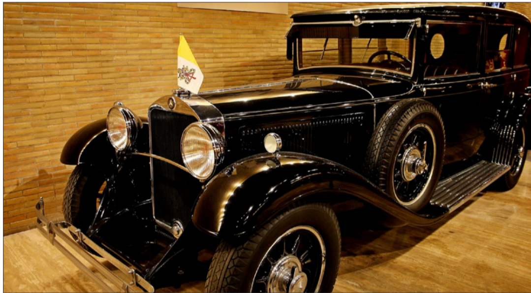
Das erste „Papamobil“: Bei diesem Auto handelt es sich um einen Mercedes Nürburg 460 aus dem Jahr 1930. Der Nobelpreisträger und Radio-Pionier Guglielmo Marconi hat für den Wagen übrigens ein frühes Mobiltelefon entworfen, das über Funk betrieben wurde.