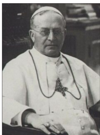
Er baute den Kirchenstaat auf.

ROM. Der größte Bauherr der letzten 200 Jahre war Pius XI. (im Bild) Nach der Gründung des Staates der Vatikanstadt im Jahr 1929 gab er etwa eine Pinakothek, ein Regierungsgebäude und eine Radiostation in Auftrag. Er rechtfertigte sich, dass er immer demselben Architekten (Giuseppe Momo) den Zuschlag gab: „Wenn du eine gründliche und gute Arbeit willst, gib sie jemandem, der schon viel Arbeit hat. Wer zu arbeiten gewöhnt ist, findet immer die Zeit. Der Faulenzer dagegen weiß nicht einmal, wie er anfangen soll.“