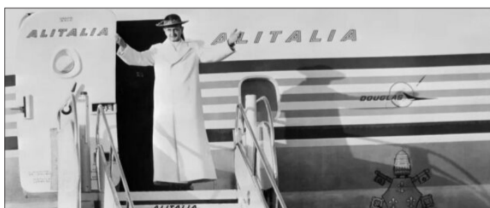
Er war der erste Papst, der ein Flugzeug bestieg.

PAUL VI.: Der erste Pontifex in der Heimat Jesu