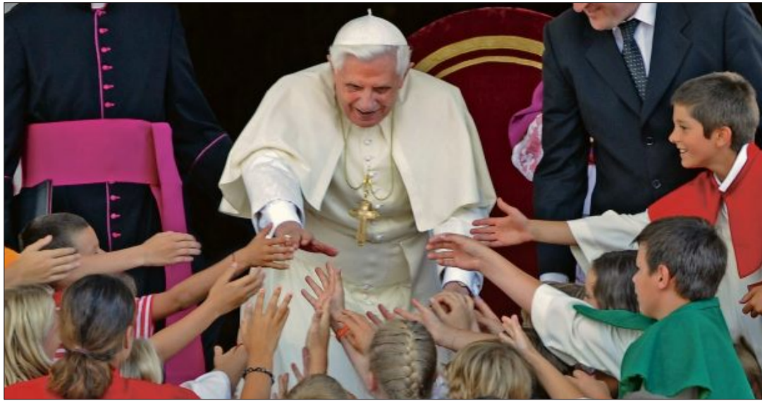
Ein Papst zum Greifen nah: Zu Benedikt XVI. hatte Südtirol eine besonders enge Verbindung, nicht zuletzt durch seinen Urlaub im Sommer 2008 in Brixen (im Bild mit Ministranten auf dem Domplatz).

leiteten die Weltkirche von 1800 bis heute. In diesem Zeitraum wuchs die Zahl der Katholiken auf der Welt von etwa 100 Millionen auf derzeit rund 1,4 Milliarden.